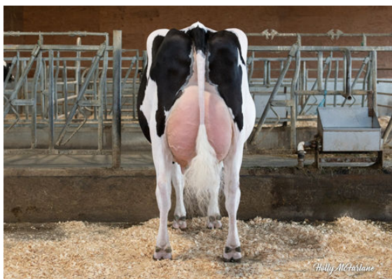
MYSTIQUE LAMBDA ANIS GRANDDAM