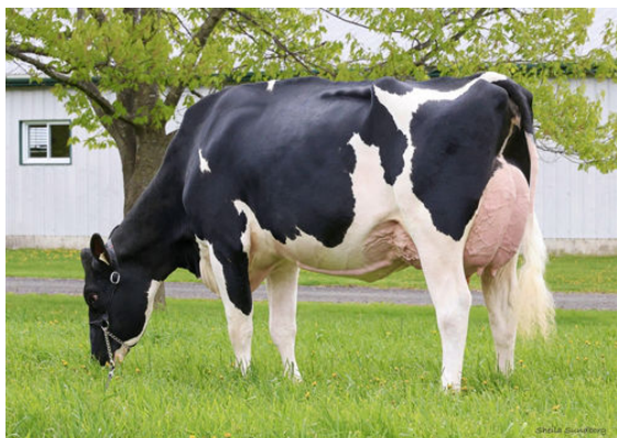
MYSTIQUE ROZUME ANICET DAM