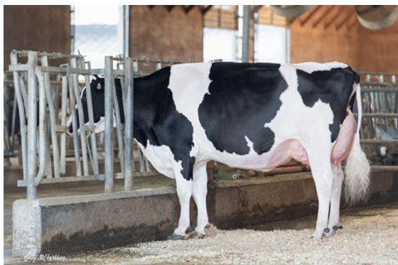
MYSTIQUE LAMBDA ANIS GRANDDAM